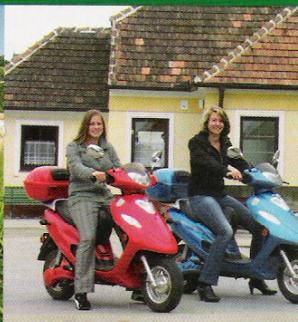
Gemeinde Fallbach Sonne und mehr, Photovoltaik und Elektromobilität