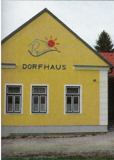
Dorferneuerungs- und Verschönerungsverein Riedenthal Dorfhaus Riedenthal