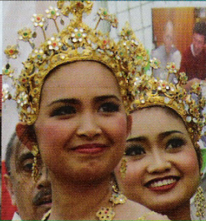
Marktgemeinde Biedermannsdorf we are the world