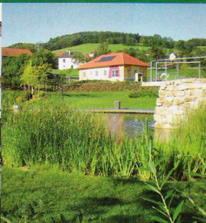
Dorfgemeinschaft Raxendorf Naturnahe Erholungs- und Freizeitanlage