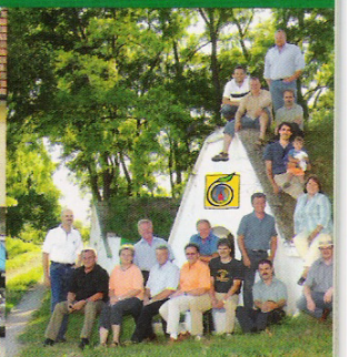
Marktgemeinde Prellenkirchen Sieger Ganzheitlichkeit