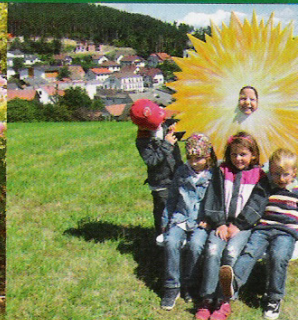
Dorferneuerungs- und Verschönerungsverein Hollenthon Familien - Wetterlehrpfad