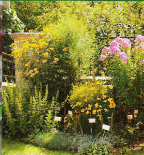
Dorferneuerungsverein Wilhelmsdorf Kräuterdorf Wilhelmsdorf