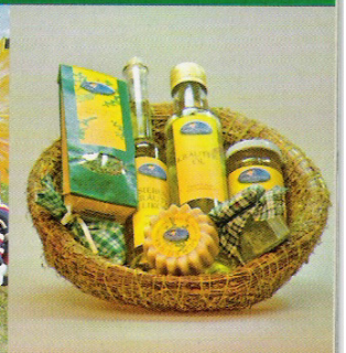
ARGE Traunsteiner G'schäftl Traunsteiner G'schäftl