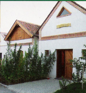
Dorfgemeinschaft Hanfthal Dorfkeller Hanfthal - Multifunktionelles Kellerensemble